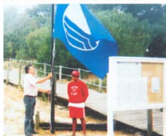
Hastear da Bandeira Azul na Praia do Cabedelo

Foram removidas oitocentas e sessenta toneladas de lixo em várias limpezas realizadas (372 toneladas na zona das barracas demolidas no lugar da Areia, 430 toneladas na limpeza da antiga bloqueira da Quinta do Sequeira e 38 toneladas no Cabedelo e 20 toneladas em locais diversos).