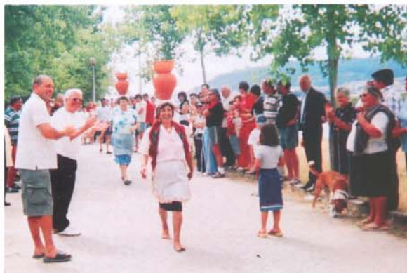
Aspecto de uma Jornada Olímpica

Reconhecendo o importante papel das associações na animação e concretização de actividades culturais, recreativas e desportivas, a Junta tem colaborado financeira e logisticamente com a Associação Desportiva Darquense, SIRD, Futsal Cais Novo, Darque Kayak Clube. As instalações desta última associação foram beneficiadas com a instalação de balneários, cujo custo rondou os 5 mil euros.