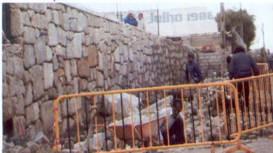
Obras na Rua Rocha Páris

Darque, comunidade civilizacional com rica e centenária história, não pode desperdiçar o legado que recebeu do seu passado. Este legado inclui o património construído, público e privado, que se espalha por todo o seu território, mas que se condensa de forma nítida no seu casco histórico. Aí, muitas vezes em ruas estreitas, onde os automóveis têm dificuldade em passar e o sol entra tímido, acumulam-se inúmeras criações arquitectónicas que reflectem a forma de ser e viver de outros tempos.