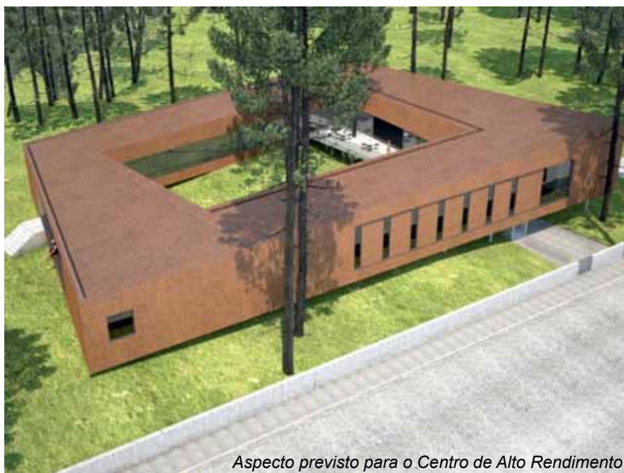
Aspecto previsto para o Centro de Alto Rendimento

A adjudicação da obra foi por 1 102 554,34€, com participação da União Europeia (Programa Feder) de 606 666,67€. Este centro vai estar dotado dos espaços seguintes: salas para formação, apoio médico e exercício físico, dormitório, refeitório e armazéns para os equipamentos dos atletas.